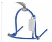
Motorisé à 4 points