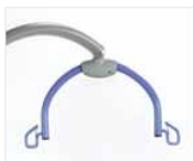
Gamme de berceaux mobiles