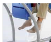
Espace exceptionnel pour les jambes