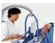
Meilleur contact visuel