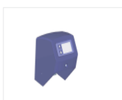
Pesée (en option)