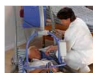
Ramassage au sol en toute sécurité