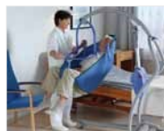
Absence de balancement