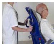
Poignées directionnelles ergonomiques