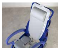
Confort et soutien