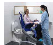
Intégration aux toilettes