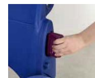
2 batteries pour 100% de disponibilité