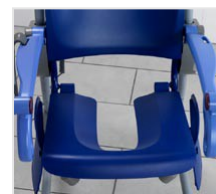
Bon accès pour la toilette