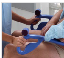
Poignées directionnelles ergonomiques